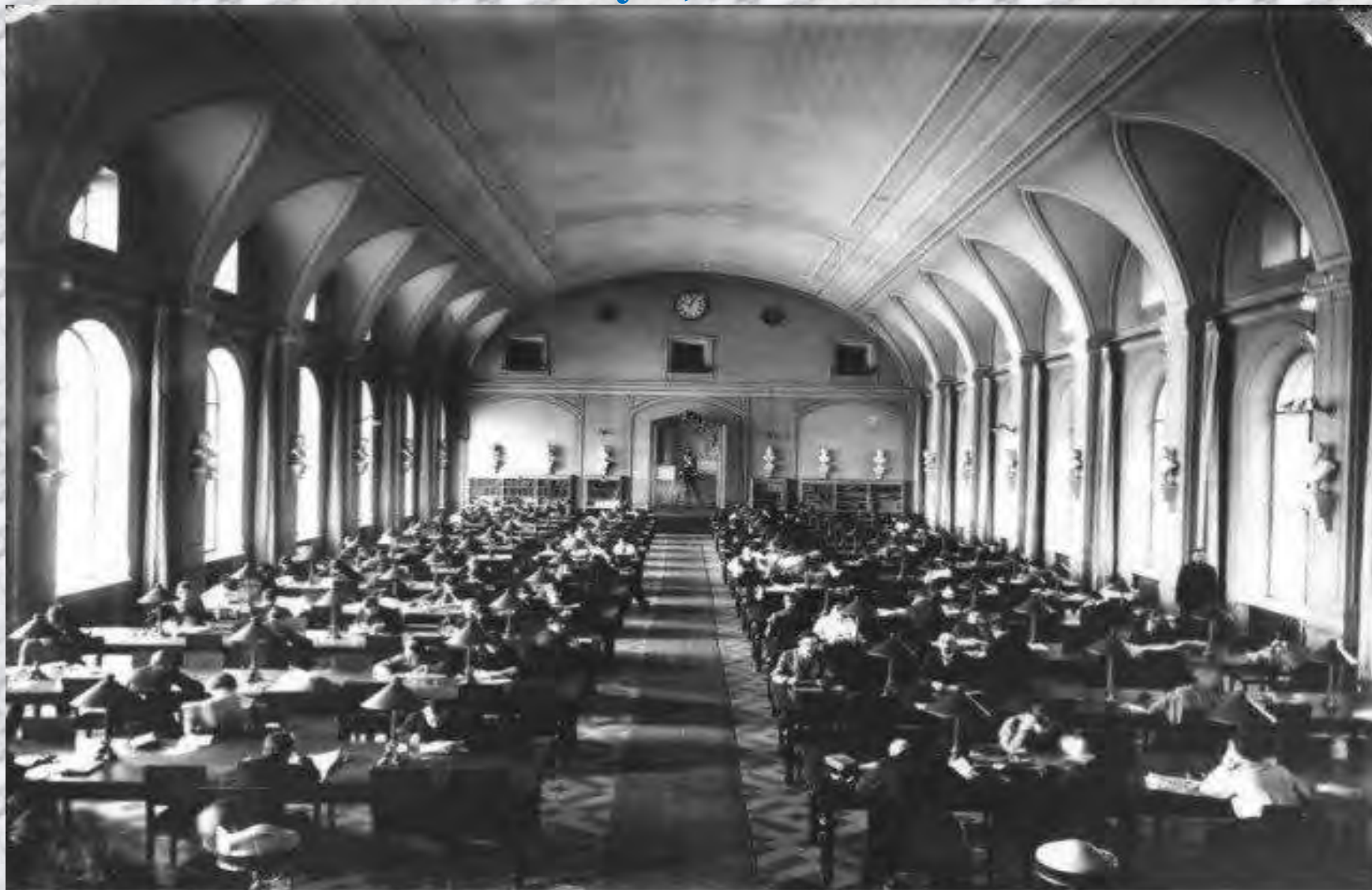
Большой читальный зал Публичной библиотеки / [1914 г.] г. Санкт-Петербург