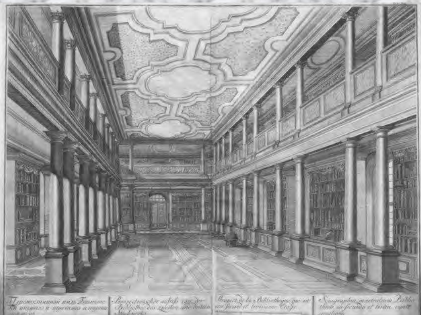
Кунсткамера и здание Академии наук, 1741 год

Наиболее важным событием в сфере библиотечного дела в эпоху правления Петра I стало учреждение в 1714 г. в Санкт-Петербурге первой государственной библиотеки в России, которая была учреждена одновременно с Кунсткамерой. В 1724 г. оба учреждения были переданы в ведение основанной в том же году Академии наук.