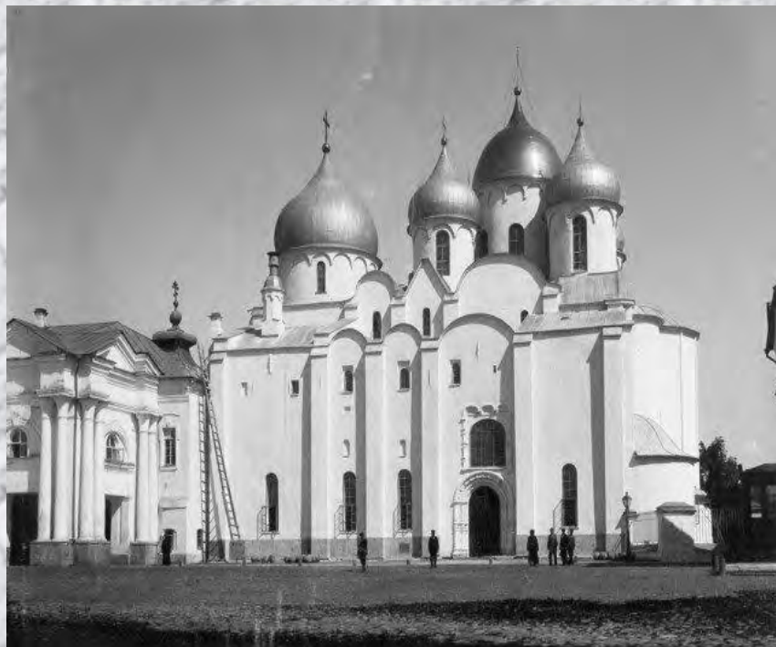
Софийский собор Новгорода, 1900 год

Вторая крупная библиотека Киевской Руси была создана в Новгороде при храме, тоже при Софийском соборе. Здесь, правда, книги гибли от многочисленных пожаров, но город избежал татаро-монгольского нашествия. Именно по этой причине из общего числа книг 12-14 веков более половины приходится на долю Новгорода. И прежде всего именно здесь сохранилась первая датированная рукописная книга- “Остромирово евангелие”. Оно было создано дьяконом Григорием.