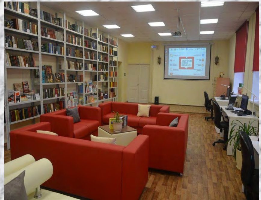
Центральная городская библиотека имени И.А. Гончарова в Ульяновске

В России утвержден модельный стандарт переоснащения библиотек. В него входят современное библиотечное пространство, открытый доступ к книгам, централизованное подключение к электронным и цифровым ресурсам, пространство свободного общения (дискуссионные клубы, консультационные пункты и лектории для всех возрастных групп).